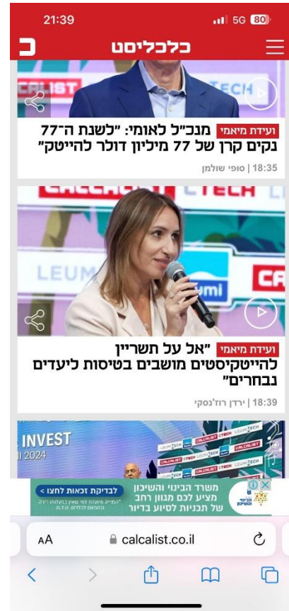
העיקר שלא תצוץ תחרות.

ממה שאני מבין מההתנהגות שלהם, וזאת הפרשנות שלי בלבד, אם הם יכלו להעתיק את כל העם שלנו לאי בודד (ולגרום לעם לשלם על זה) ולהיות היחידים שיש להם שליטה על כניסה ויציאה מהאי, הם היו ממשיכים להגיד שיש לאזרחים אלטרנטיבות שונות כמו לשחות באוקיינוס, ושהם מספקים מוצר במחיר הוגן לאזרחים ושהאלטרנטיבה של שחייה באוקיינוס מלא בכרישים היא תחרות אמיתית בשבילם שהיא סתירה מוחלטת להגדרה של מונופול. הם מזכירים לי את הפתגם: